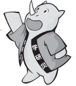
Sai-chan, nhân vật đại diện của Bảo hiểm tai nạn cho sinh viên Gakkensai

Khi đang tham gia các hoạt động giáo dục, nghiên cứu có nghĩa là như thế nào... Là khi đang tham gia lớp học, và các hoạt động tại trường, v.v... Các bạn hãy tham khảo phần bên dưới để biết thêm thông tin chi tiết!