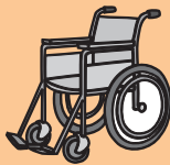
スキー中に木に衝突し、 後遺障害が生じてしまった…