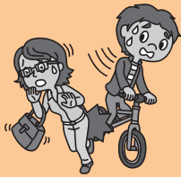
歩行者に衝突！ ケガをさせてしまった…