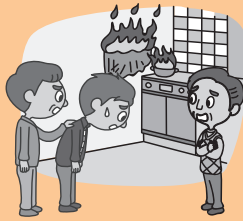
アパートで火災を 起こしてしまった…

留学生本人が＜日常生活における事故＞または＜留学のための宿泊・居住施設の使用等における事故＞によって他人にけがをさせたり、他人の物を壊したりして損害賠償責任を負った場合に、保険金をお支払いします。